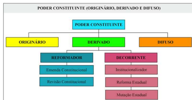
DIAGRAMA DOS TIPOS DE PODER CONSTITUINTE